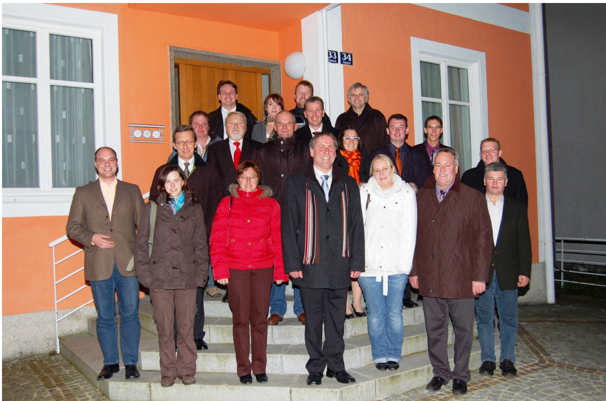
Der neue Gemeinderat - Aufbruch in das Gasthaus Höckner-Keller