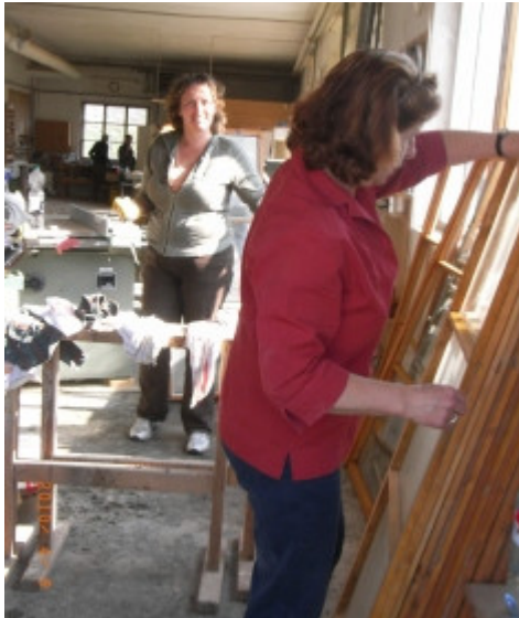
Gemeinsames Fensterputzen in Ungenach